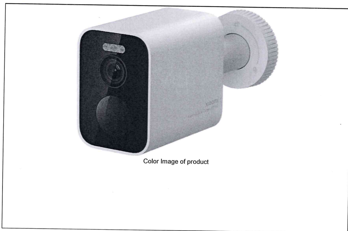
Color Image of product